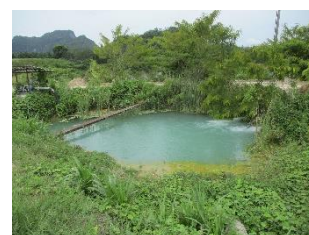
บ่อดักตะกอน