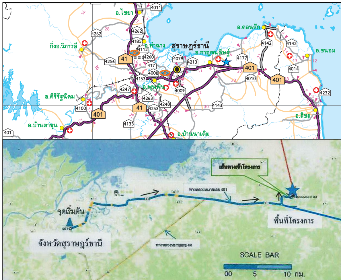
รูปที่ 1-3 แสดงเส้นทางคมนาคมเข้าสู่พื้นที่โครงการ