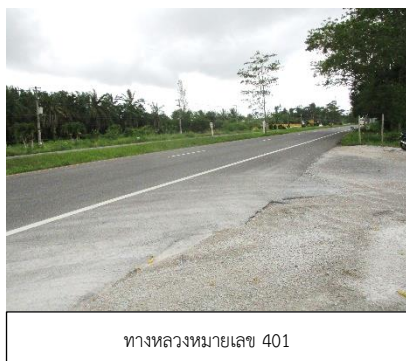
ทางหลวงหมายเลข 401