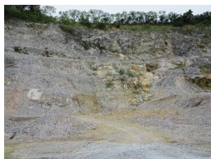
พื้นที่หน้าเหมือง