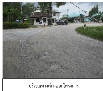
บริเวณทางเข้า-ออกโครงการ