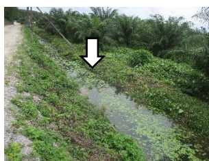
คูระบายน้ำ