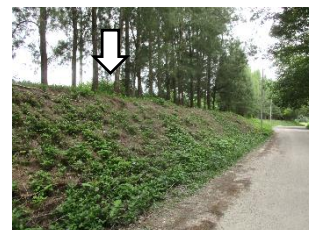
คันทำนบดิน